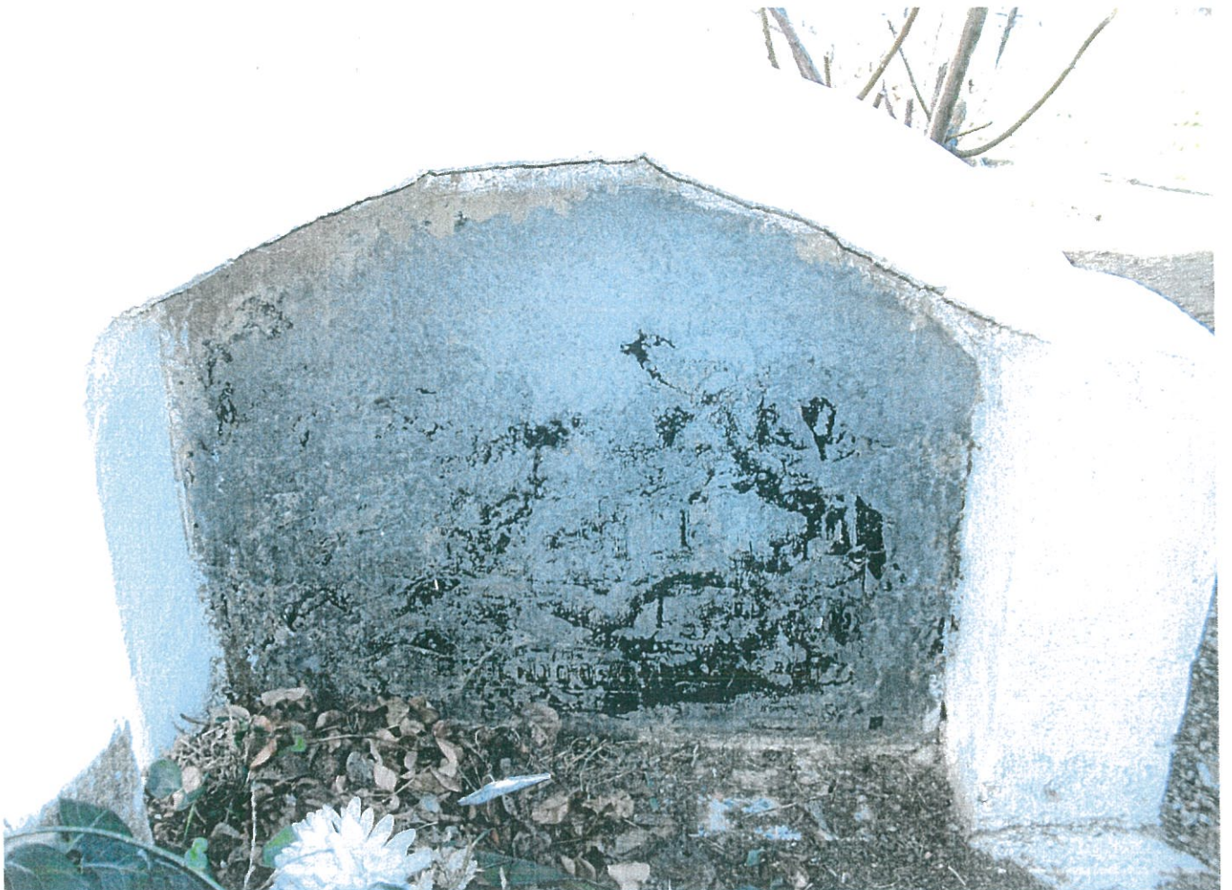
FOTOGRAFIA N° 3