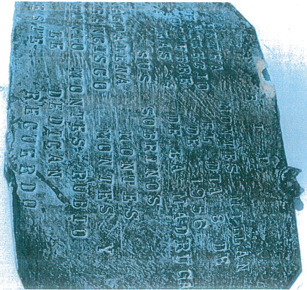
FOTOGRAFIA N.º 1